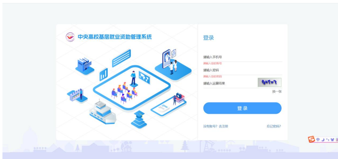
图 2- 1 学生登录页面

在弹出的注册页面填写相关信息，密码需符合页面密码强度要求，点击<注册>按钮即可注册成功。如图：