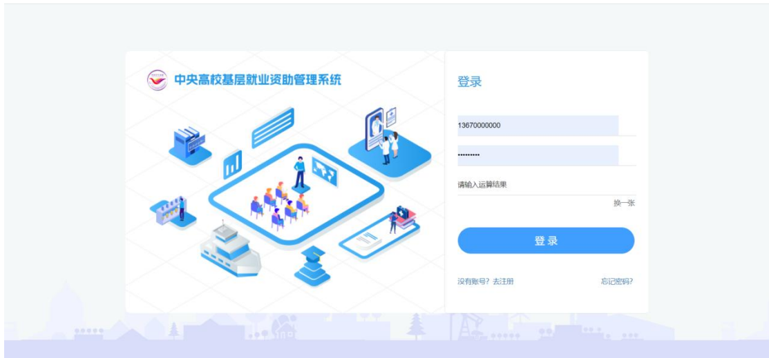
图 2- 4 学生登录页面

在弹出的忘记密码页面填写相关信息，密码需符合页面密码强度要求，点击<修改密码>按钮，即可修改成功，如图：