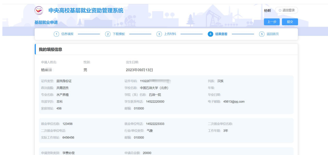
图 2- 11 基层就业结果查看页面