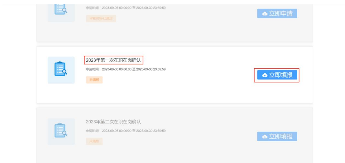
图 2- 20 第一次在职在岗确认入口页面

提交基层就业申请通过的学生第二年可以在要求的在职在岗时间范围内填报第一次在职在岗确认信息，点击第一次在职在岗确认模块的<立即申请>按钮，如图：