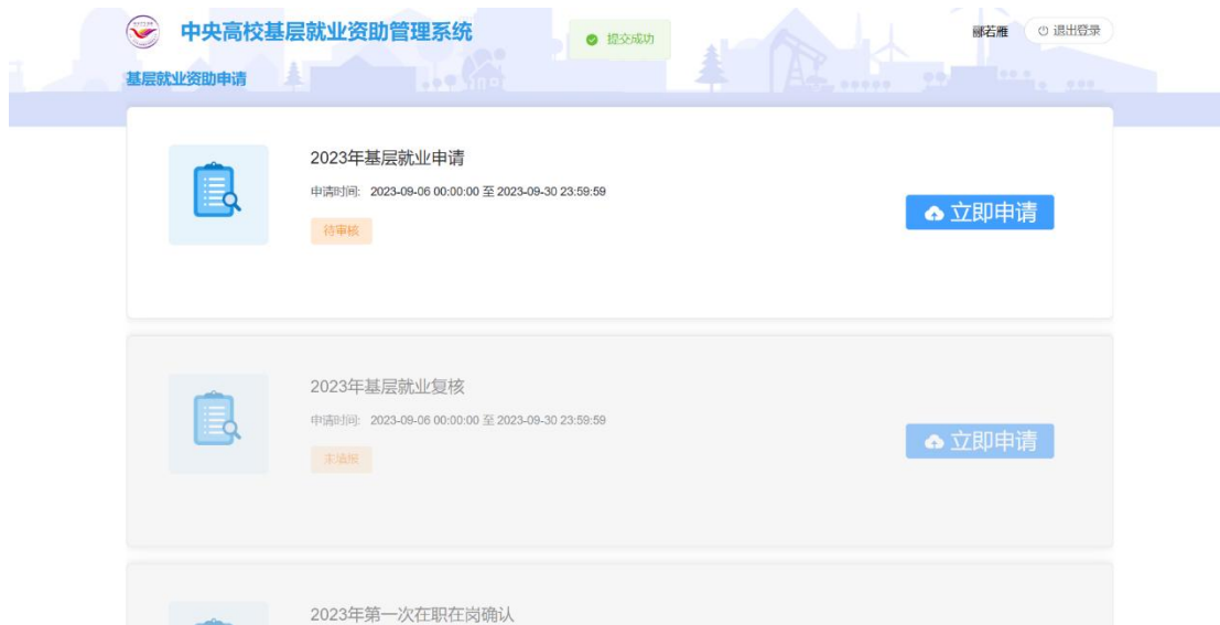
图 2- 12 基层就业申请状态页面