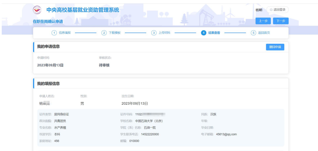
图 2- 25 结果查看页面

确认无误后点击<提交>按钮，即填报完成，申报入口处状态变成待审核，提交之后，学院审核之前，可以撤回申请。