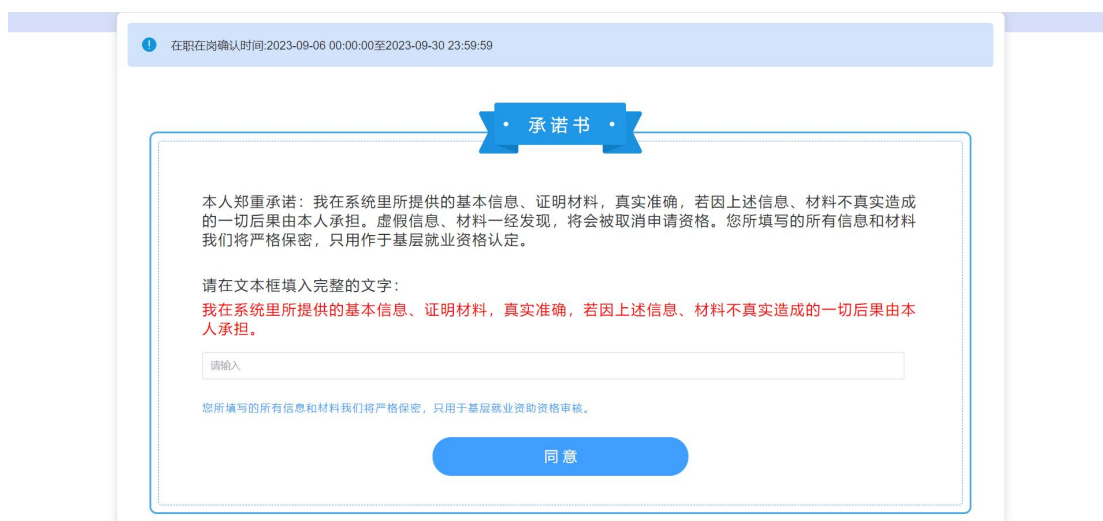
图 2- 27 承诺书