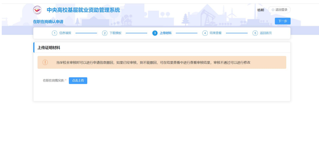
图 2- 30 上传证明材料页面