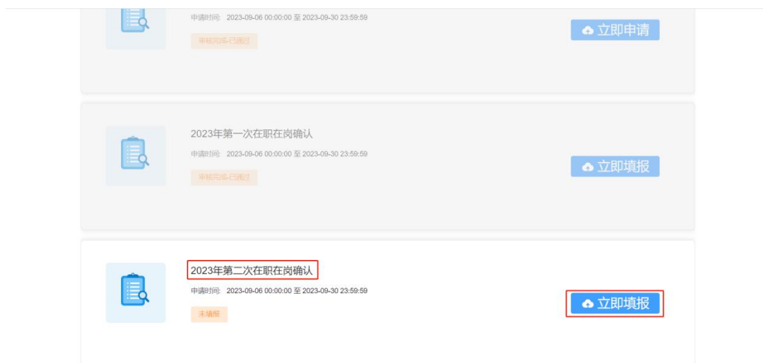
图 2- 26 第二次在职在岗确认入口页面

时间范围内填报第二次在职在岗确认信息，点击第二次在职在岗确认模块的<立即申请>按钮，如图：